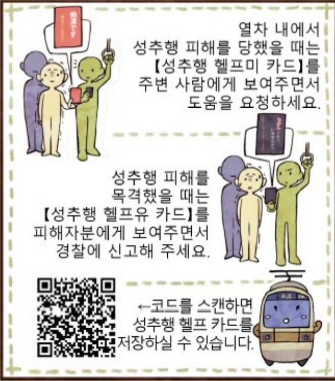
성추행 헬프미 카드