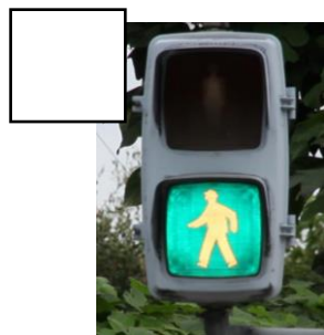
しんごうが あるところ

① 学校 の いきかえり で、 どんな ところ を とおる かな？ 下の しやしん の 中か ら、 ある もの に ○ を つけ よう。 おうち の ひと に も きいて みよう。