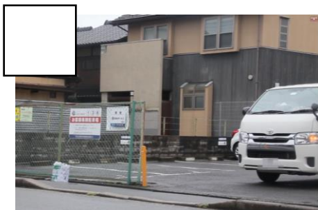
ちゅうしゃじょうのまえ