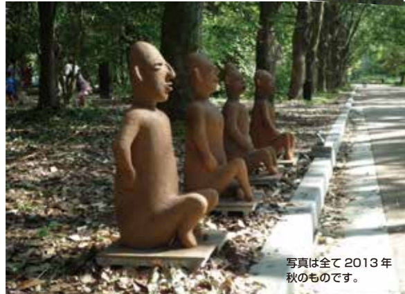
写真は全て2013年秋のものです。