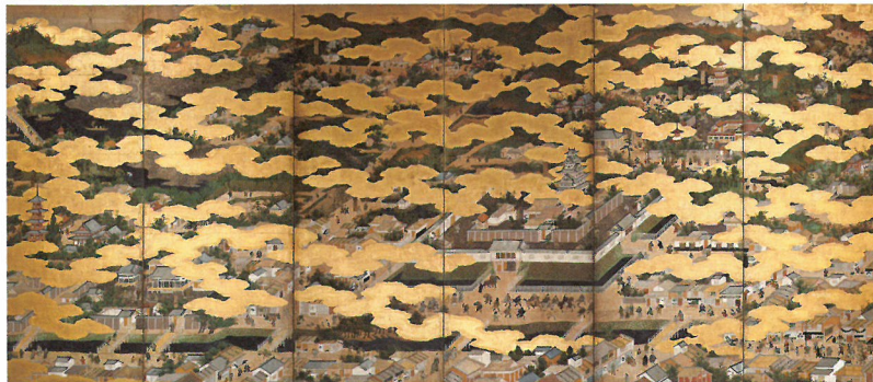
狩野派《洛中洛外図屏風》左隻 江戸時代前期 17世紀