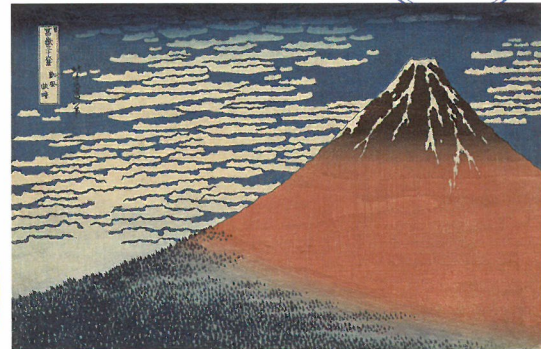
葛飾北斎《富嶽三十六景 凱風快晴》天保1-天保3年(1830-32)頃