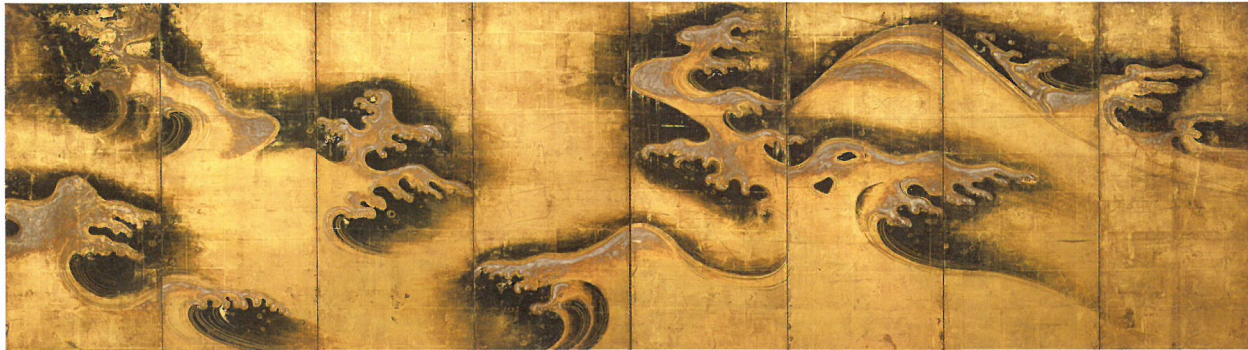
琳派《波瀾図屏風》江戸時代中期 18世紀