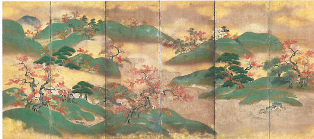
狩野派《吉野山竜田川図屏風》左隻 江戸時代前期 17世紀