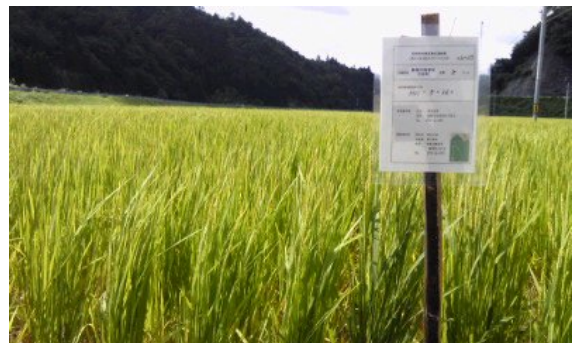
特別栽培米表示 無農薬の京都旭

収穫時期が10月中旬で、モミが脱粒しやすい為、栽培しやすい品種が普及し、近年ほとんど作付けされなくなった「幻のお米」です。無農薬米・特別栽培米とございますのでどうぞ一度ご賞味ください。