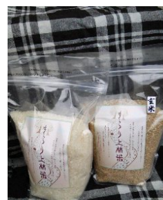
食べやすい1キロ米から試してみ