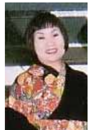
イチオシ、リポーター