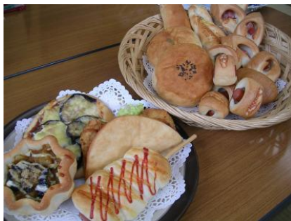
～ 大人気 米粉パン ～