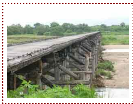
～時代劇の撮影で有名な「流れ橋」～

地元の農産資源を使った農産加工品の開発や、普及活動通して、地域の活性化と市民交流を目指しております。また、昔からの食文化の伝承にも力を入れています。