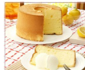
～ 新商品 お米のシフォン ～