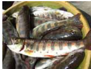
08年度 炭焼き + アマゴ釣りワークショップ