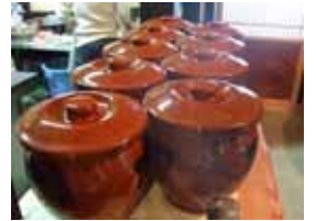
たくさんの味噌ができました