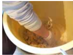
08年度 味噌作りワークショップ