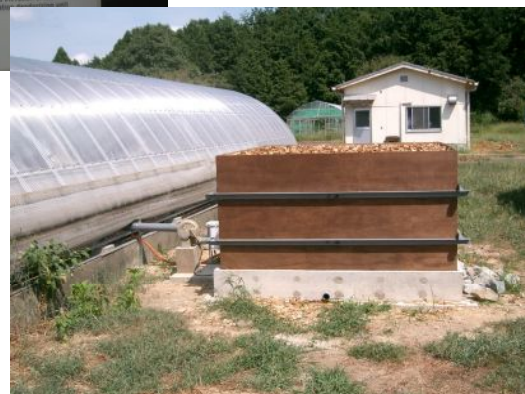
当センターに設置の樹木チップを用いた低コスト脱臭装置