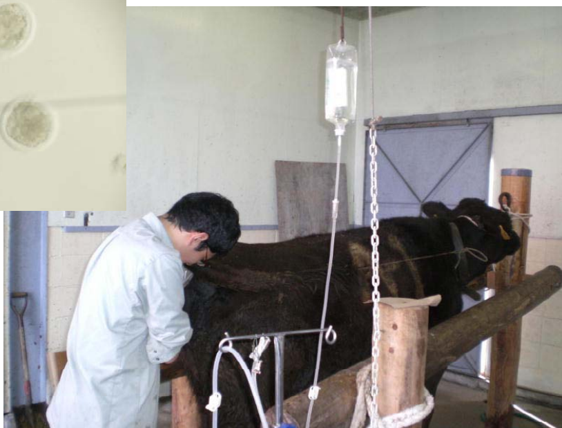
牛（黒毛和種）と受精卵を採取する技術者