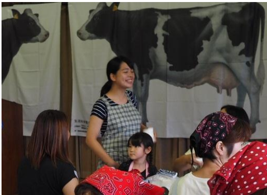
夏休み親子畜産ふれあい広場にも参加

除ふんや子牛の哺乳をはじめ家畜を管理するための一連の作業を行う中で、特に「乳牛の搾乳が楽しい」と瞳を輝かせて語る姿に、将来の担い手としての期待が高まります。