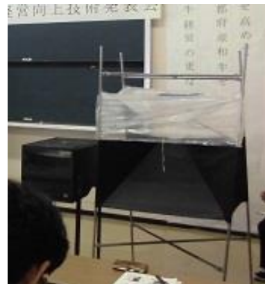
2種類のアブトラップ