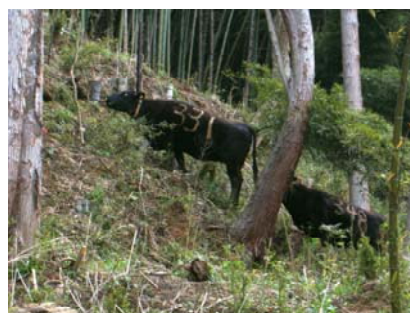
写真：緩傾斜地のタケノコを積極的に食べに行く