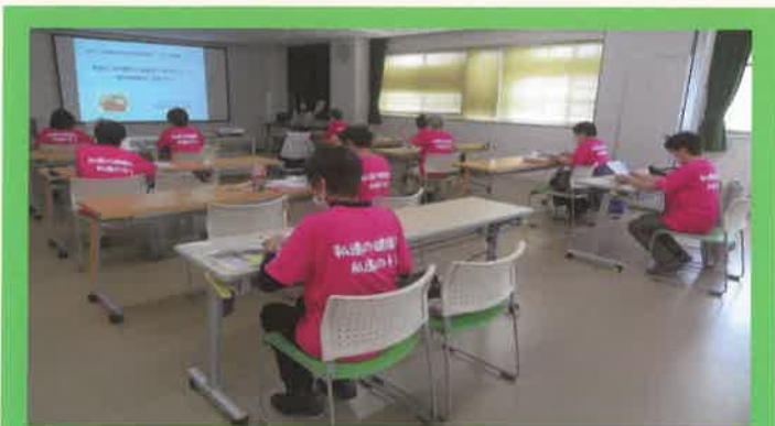
管内食生活改善推進員リーダー研修会 (R2.9.25(金))

新型コロナウイルス感染予防対策として、受講者・スタッフの体調確認、会場を定員の半数以下のもと、消毒、換気等を実施