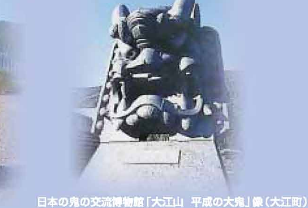
日本の鬼の交流博物館「大江山 平成の大鬼」像(大江町)