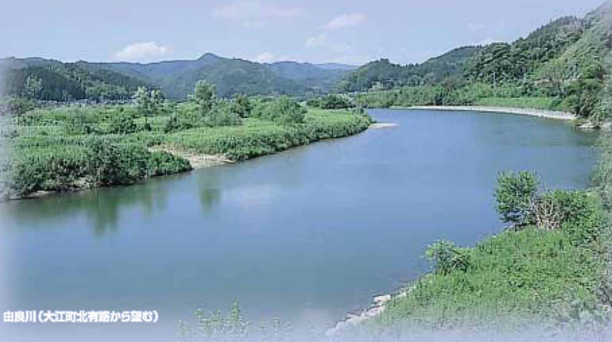
由良川(大江町北有路から望む)