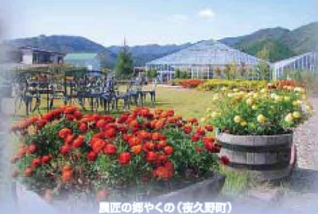
農匠の郷やくの(夜久野町)