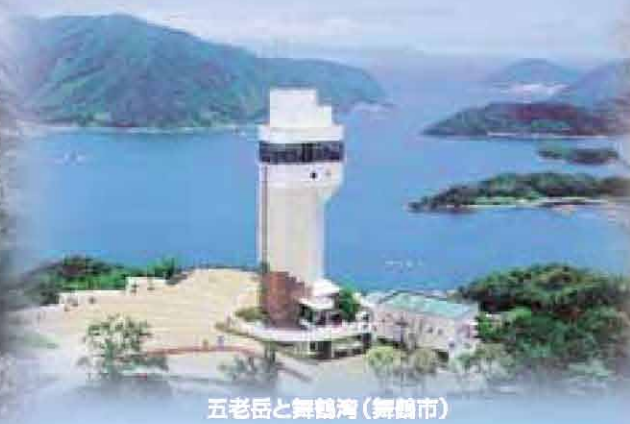
五老岳と舞鶴湾(舞鶴市)