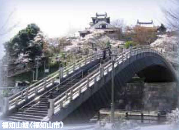
福知山城(福知山市)

京都府中丹広域振興局 〒625-0036 舞鶴市字浜2020 TEL.0773-62-2031 FAX.0773-63-8495 京都府中丹広域振興局ホームページ http://www.pref.kyoto.jp/chutan/