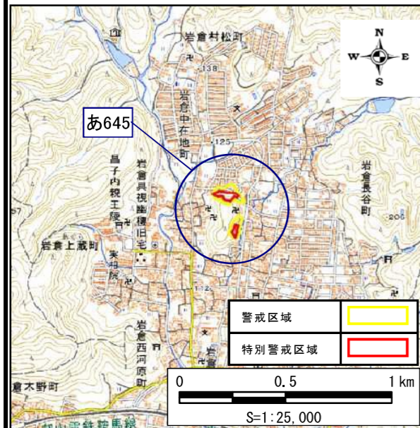
土砂災害警戒区域・土砂災害特別警戒区域 位置図

この地図は、国土地理院長の承認を得て、同院発行の数値地図25000(地図画像)を複製したものである。 (承認番号 平22業復、第427号)