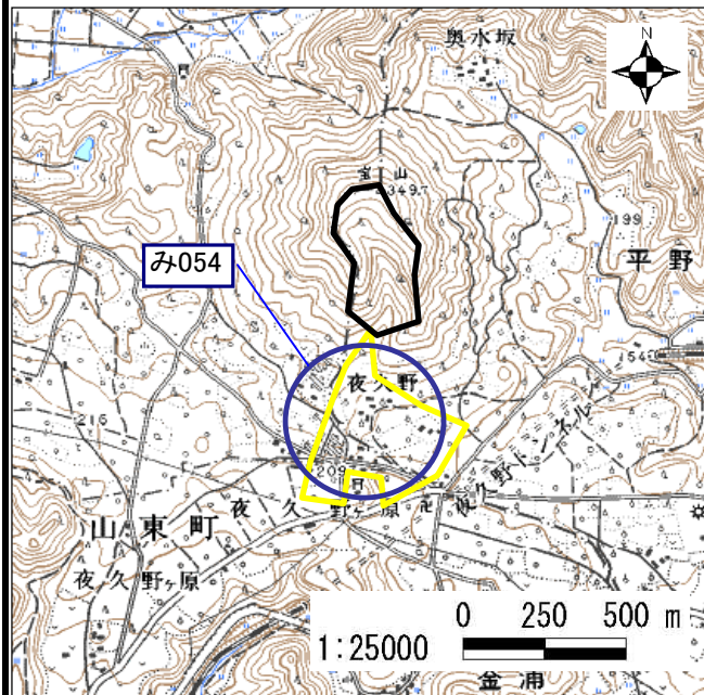
土石災害警戒区域・土石災害特別警戒区域 位置図

この地図は、国土地理院長の承認を得て、同院発行の数値地図25000 (地図画像)を複製したものである。(承認番号 平20業複、第890号)