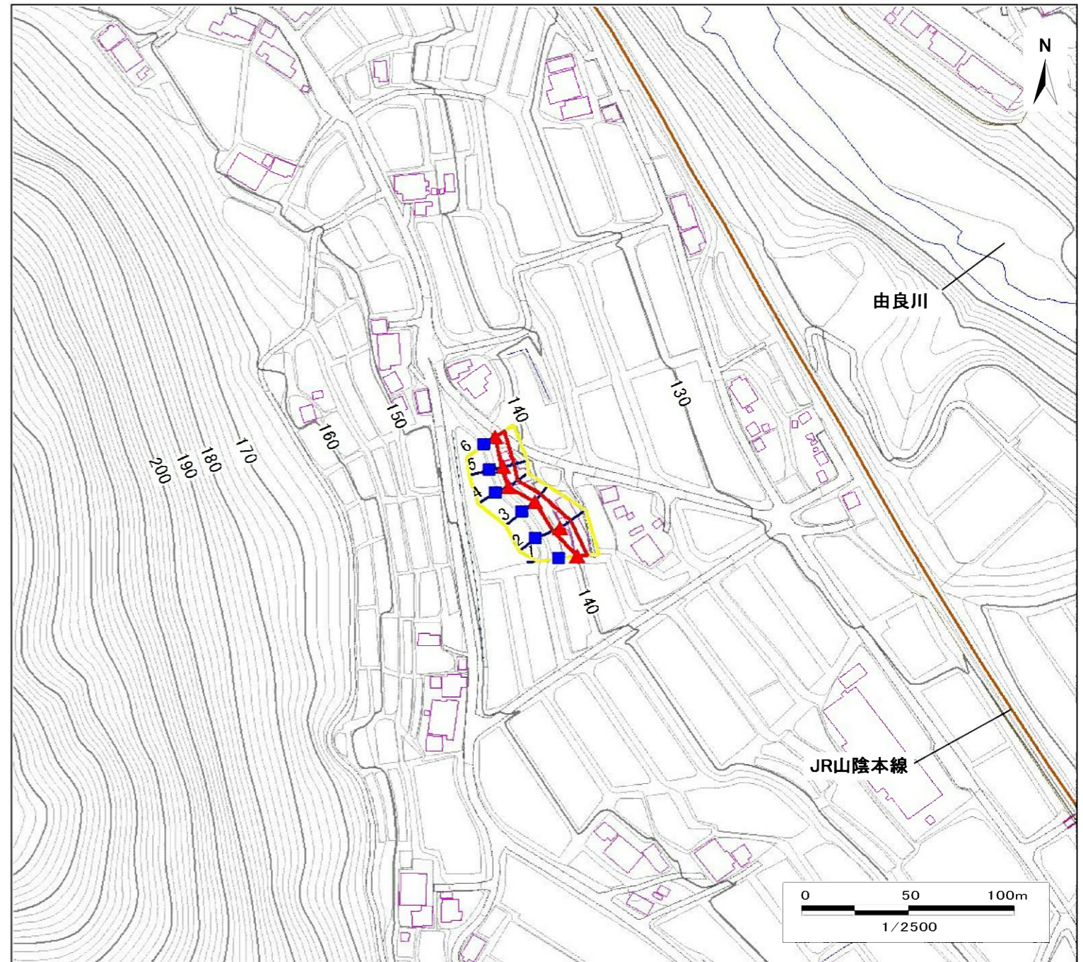
土砂災害警戒区域・土砂災害特別警戒区域 区域図

・この地図は、国土地理院長の承認を得て、同院発行の数値地図25000(地図画像)を複製したものである。(承認番号 平22業複、第580号)