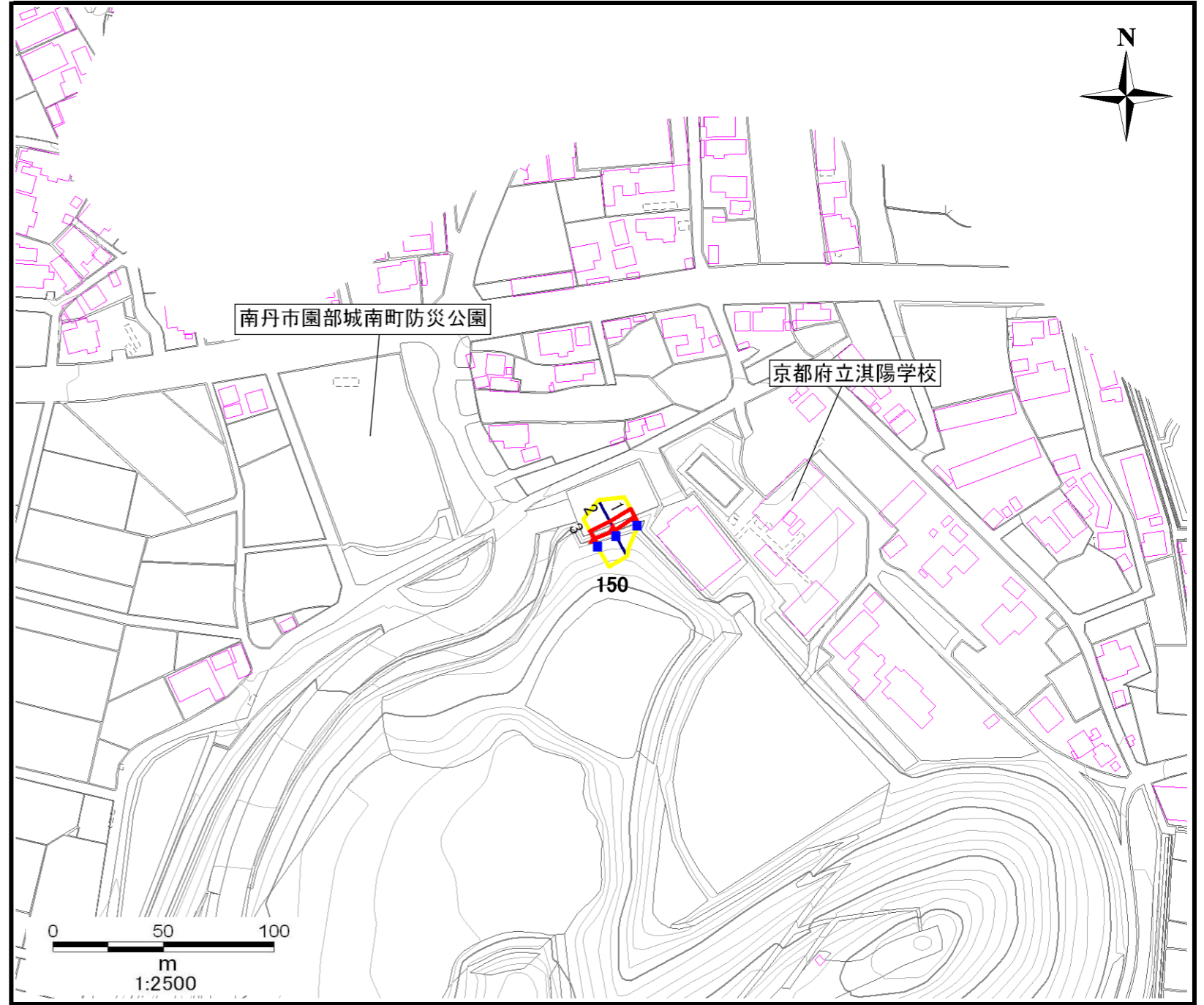
土砂災害警戒区域・土砂災害特別警戒区域 区域図