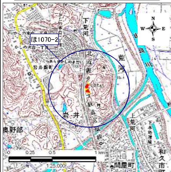
土砂災害警戒区域・土砂災害特別警戒区域 位置図

・この地図は、国土地理院長の承認を得て、同院発行の 数値地図25000(地図画像)を複製したものである。 (承認番号 平24情複、第580号)