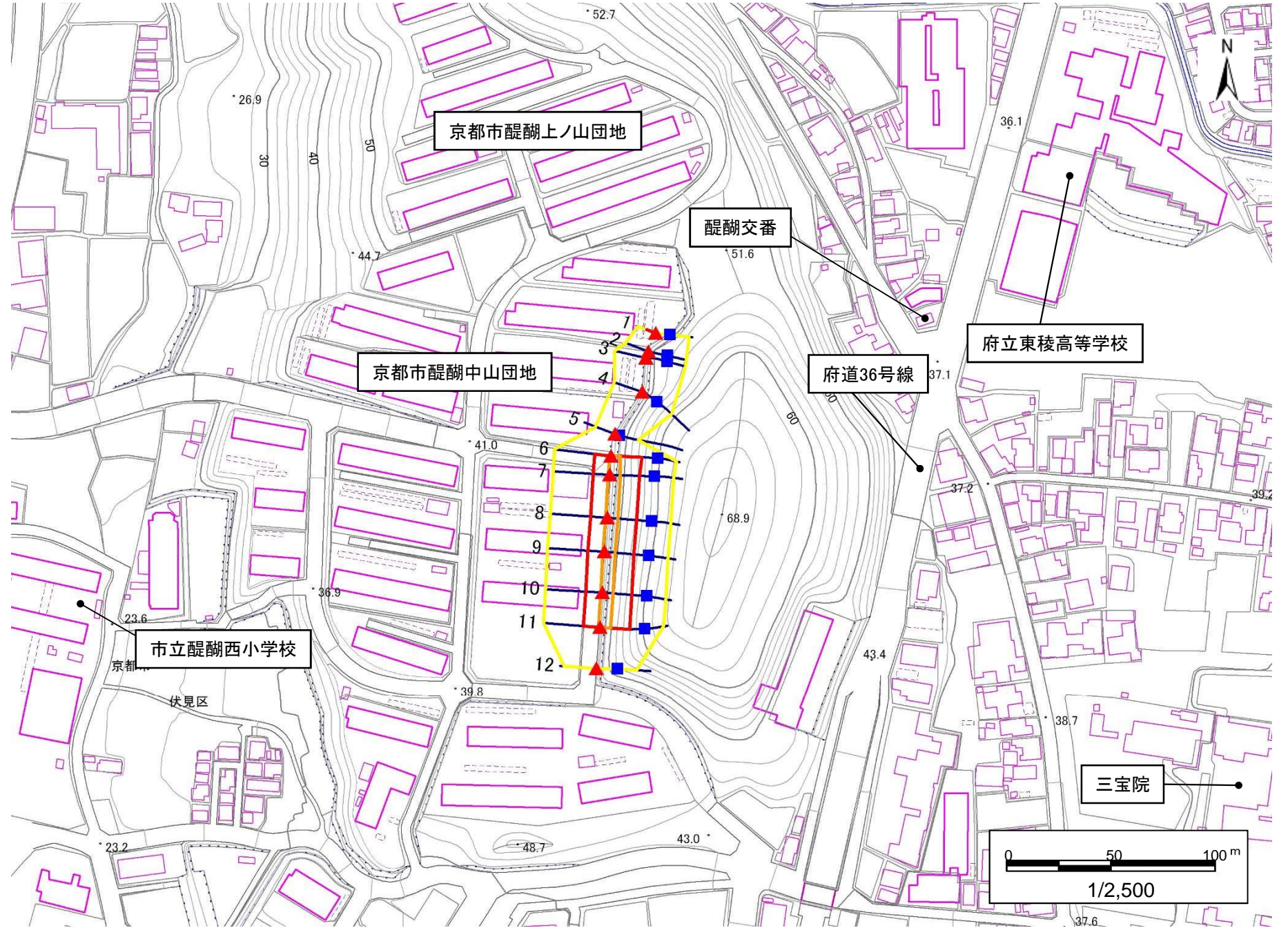
土砂災害警戒区域・土砂災害特別警戒区域 区域図

この地図は、国土地理院長の承認を得て、同院発行の数値地図25000(地図画像)を複製したものである。 (承認番号 平22業複、第580号)