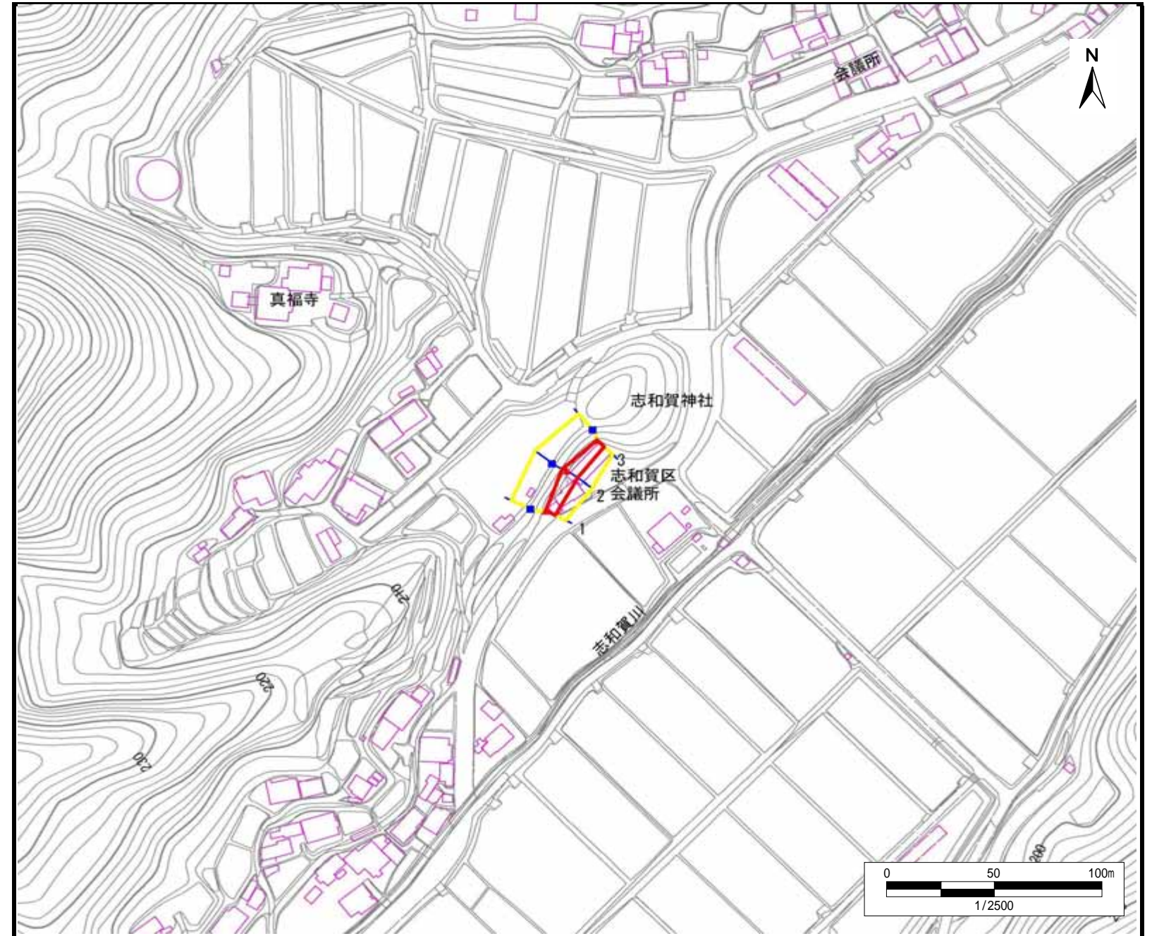
土砂災害警戒区域・土砂災害特別警戒区域 区域図