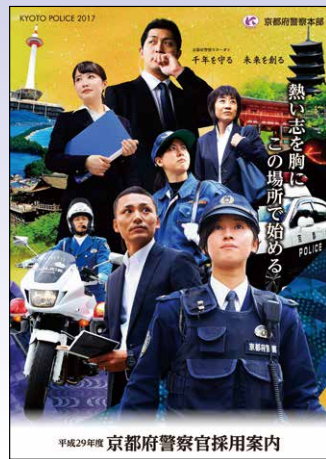
平成29年度 京都府警察官採用案内