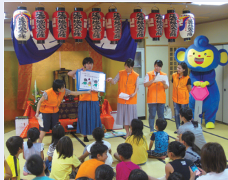
ロックモンキーズによる防犯教室