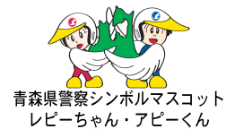
青森県警察シンボลมスコット レピーちゃん・アピーくん

京都ではこのような方言はなかなかありませんが、あなたの家には、家族の間でしか通じない物の言い方はありませんか？是非探して活用してみてください！