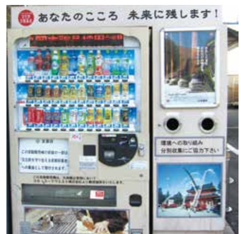
寄附機能付き自販機（フレスコ五条西洞院店）