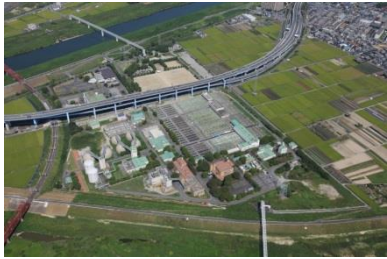
木津川上流流域下水道 木津川上流浄化センター