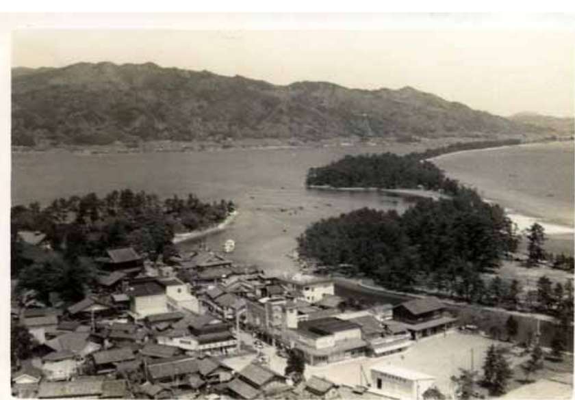
飛龍観 1 (昭和30代)