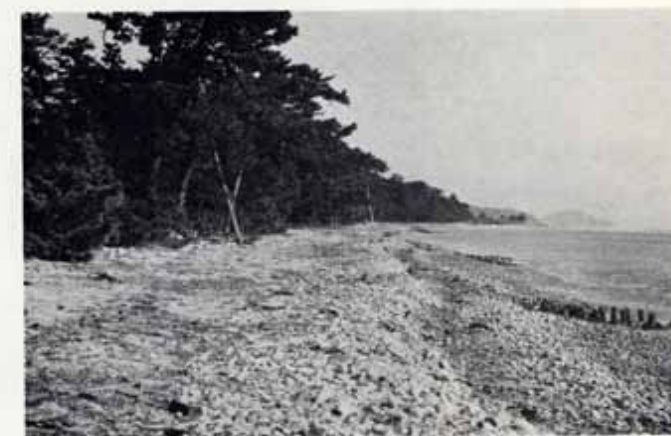
天橋立公園 大天橋地区