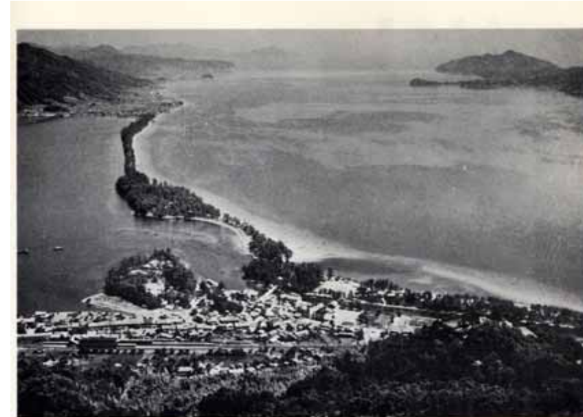
天橋立公園 上空よりみた天橋立公園手前文珠地区、前方江尻地区、向って左側が阿蘇山、右側は宮津湾