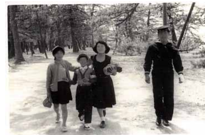
松並木の中 (昭和30年代)