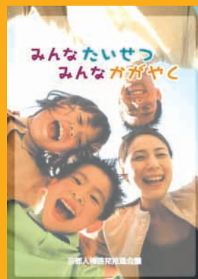
みんなたいせつ みんなががやく