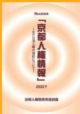
京都人権情報 2007 ～NPO法人等の取組について～