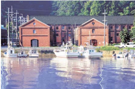
赤れんがと青い海