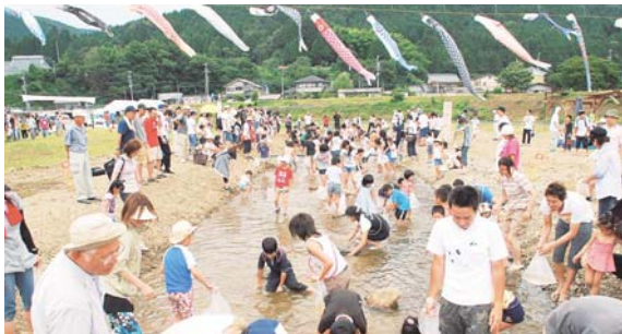
田舎暮らし体験イベント