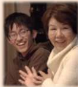
Ⓢ 高齢者(夫婦) 京都市北区在住 Ⓢ 大学生(男性) 奈良県出身

Ⓢ 奈良の実家から大学まで往復3時間を費やしていましたが、ゆっくり朝ご飯が食べられるようになり、学外活動の時間も充実しました。