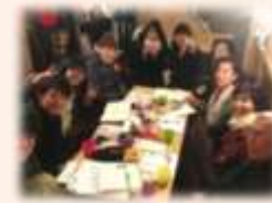
お茶会・交流会のようす