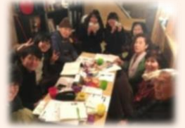
お茶会・交流会のようす