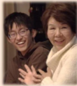
Ⓢ 高齢者(夫婦) 京都市北区在住 Ⓢ 大学生(男性) 奈良県出身

Ⓢ 奈良の実家から大学まで往復3時間を費やしていましたが、ゆっくり朝ご飯が食べられるようになり、学外活動の時間も充実しました。