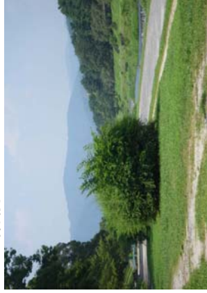
繁茂しすぎた樹木 →撤去