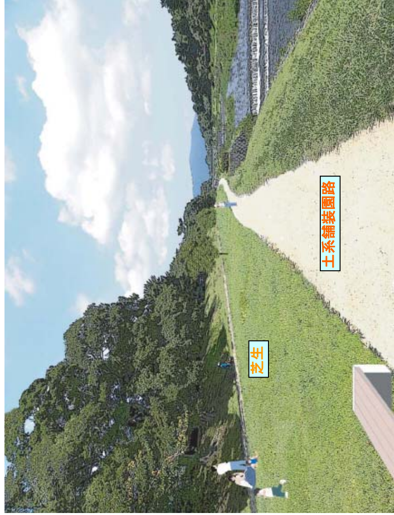
▼整備後のイメージ