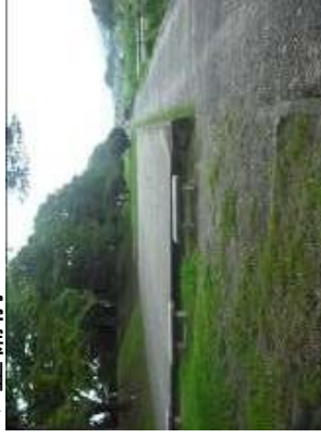
利用が少なく、老朽化した公園施設 →撤去