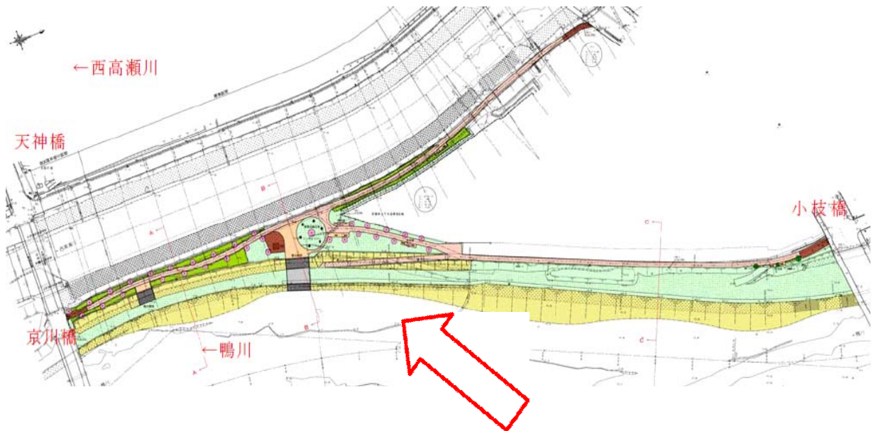
しだれ桜(シンボル)