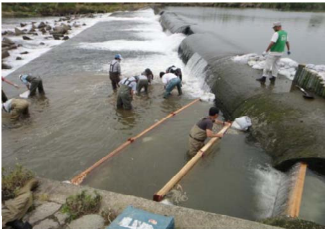
仮設魚道の設置作業