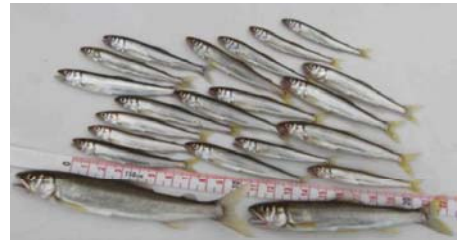
天然アユ(上)と放流アユ(下)