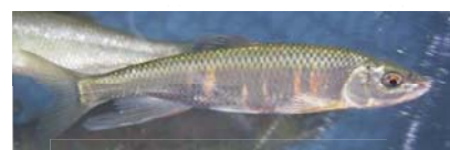
オイカワ(シラハエ)