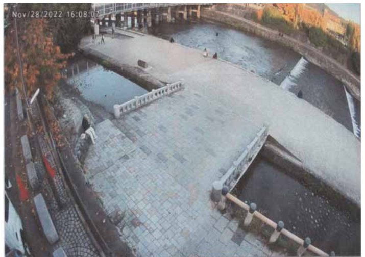
監視カメラによる想定監視エリア