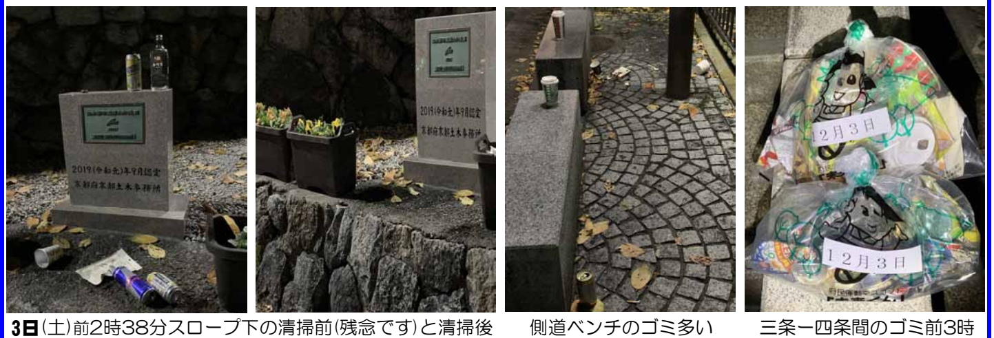
3日(土) 前2時38分スロープ下の清掃前(残念です)と清掃後 側道ベンチのゴミ多い 三条一四条間のゴミ前3時