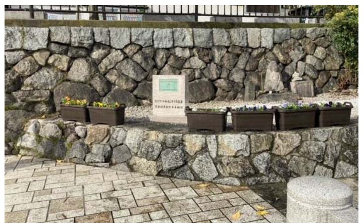
再設置されたプランター(アンカー付き)