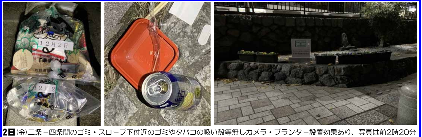
2日(金) 三条一四条間のゴミ・スロープ下付近のゴミやタバコの吸い殻等無しカメラ・プランター設置効果あり、写真は前2時20分