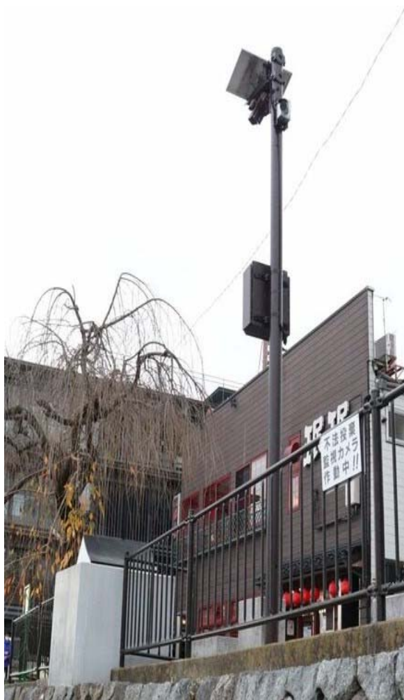
不法投棄監視カメラ

鴨川を美しくする会が、鴨川三条小橋付近に不法投棄防止のための監視カメラを設置されることとなり、本年8月に損壊を受けたプランターについても、京都土木事務所において再設置することとなりました。本件について、同会を主催者として11月30日(水)に設置の紹介が行われました。