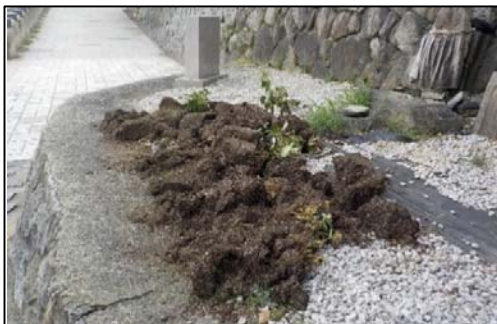
6月設置当時のプランター

・何者かによりプランター6個がひっくり返され、プランター本体はみそそぎ川に投げ捨てられる。