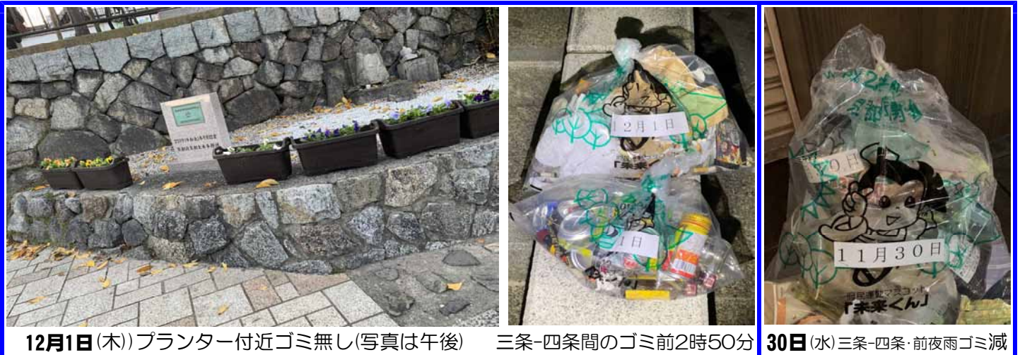
12月1日(木) プランター付近ゴミ無し(写真は午後) 三条-四条間のゴミ前2時50分 30日(水) 三条-四条・前夜雨ゴミ減