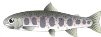
あまご描画：中筋祐司