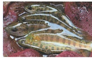
令和3年の賀茂川上流の釣果例