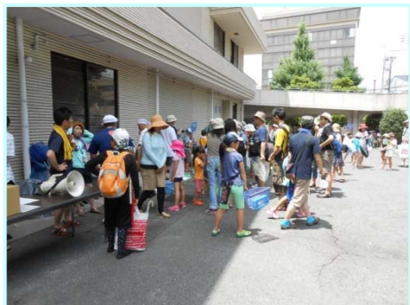
あみを持っていざ鴨川へ！