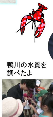
鴨川の水質を調べたよ