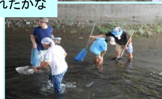
なにかとれたかな