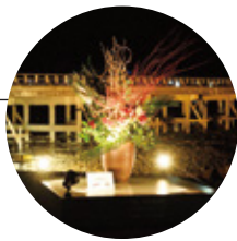
「いけばな プロムナード」