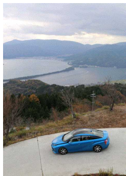
トヨタ賞 (京都府宮津市)