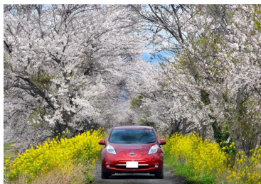
最優秀賞 (滋賀県長浜市)