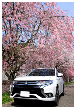
優秀賞 (京都府南丹市)