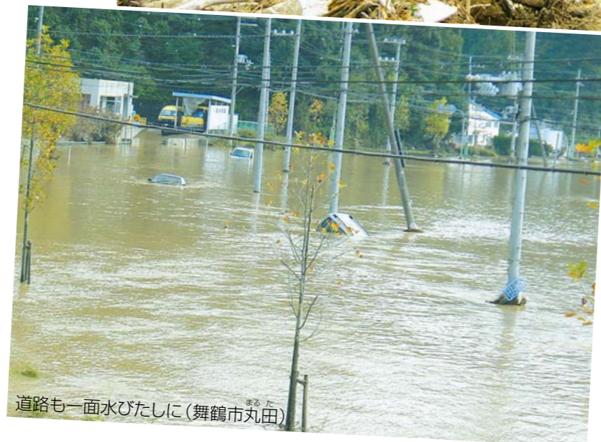
道路も一面水びたしに(舞鶴市丸田)