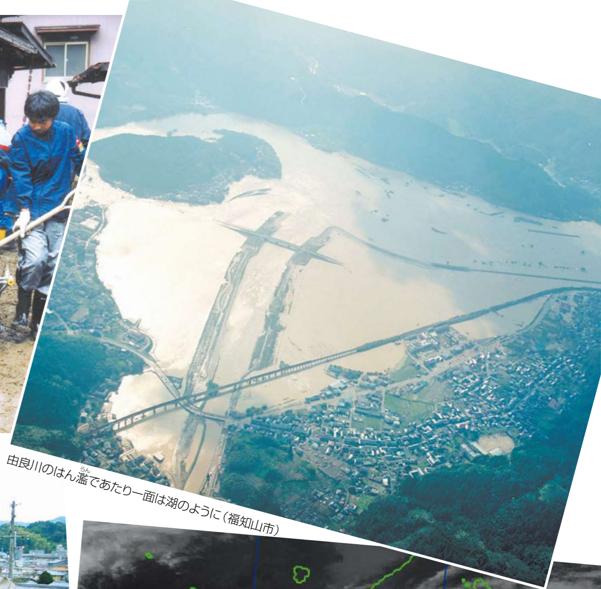
由良川のはん濫であたり一面は湖のように(福知山市)