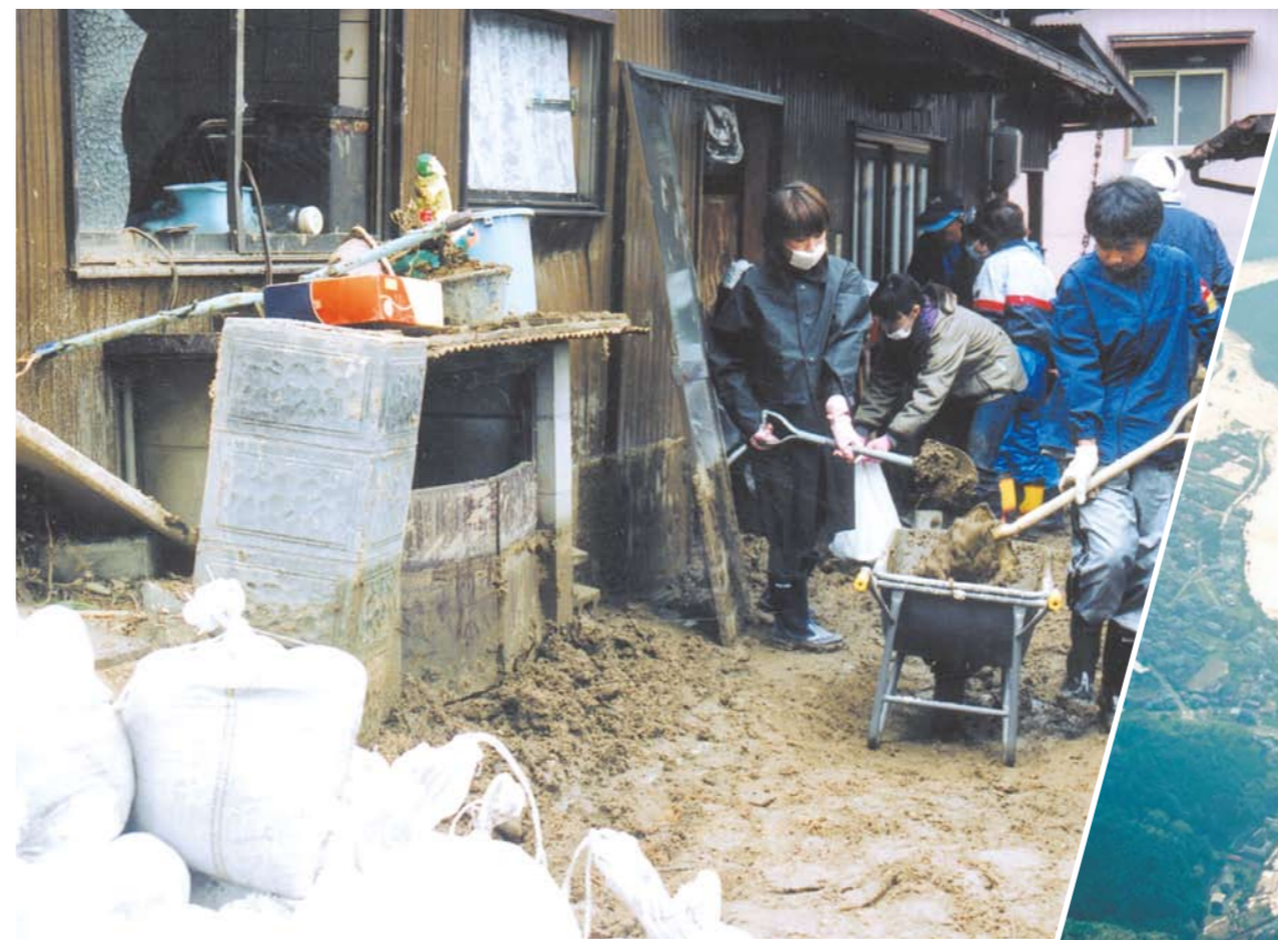
みんなで力を合わせた復旧作業(宮津市)