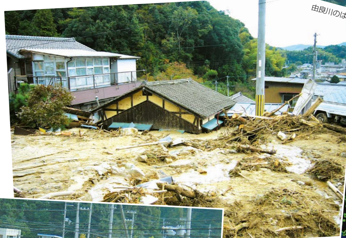
土石流によって押しつぶされた家屋(宮津市滝馬)