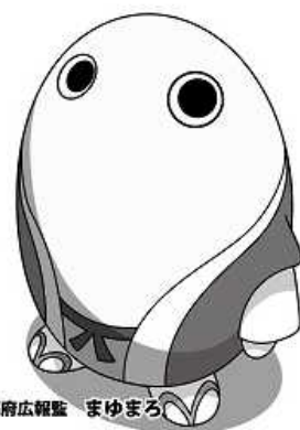
京都府広報監 まゆまる