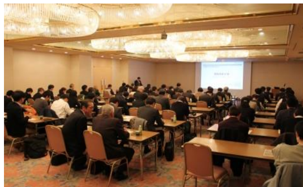
(昨年度の開催の様子)