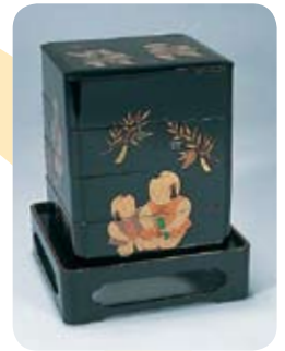
きょうしつ 京漆器