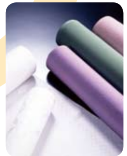
たんご 丹後ちりめん