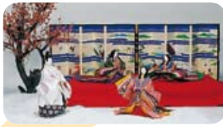
きょうにんぎょう 京人形