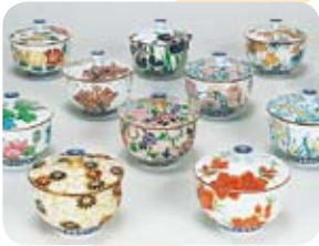
きょうやき きよみずやき 京焼・清水焼