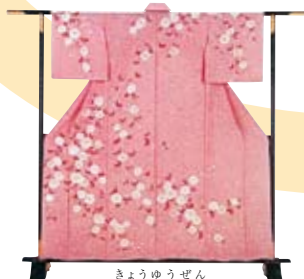
きょうゆうぜん 京友禅