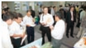
9月に開催した農商工連携フェア