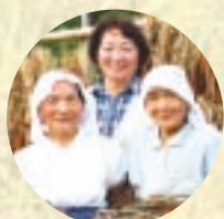
女性加工グループの皆さん

かつては下世屋地区の多くの家で作られていたあわもちを市街地で販売したところ、飛ぶように売れたんです。そこで「世屋の黄金もち」として販売しようと、粟の生産から製造に向けた取り組みを始めました。以前は米の代わりには仕方なく食べていた粟が、地域の特産品づくりに役立つようになってうれ