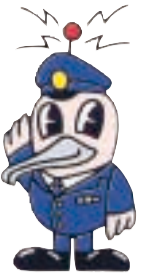
京都府警のシンボルマスコット キョッビー