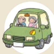
無理せず、安全運転を!