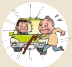
自宅近くで事故多発!

毎年、秋から年末にかけて、交通事故が増加する傾向にあります。お出掛けのときは、交通事故に遭わないように注意しましょう。