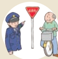
一時停止、安全確認を!