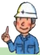
府職員が一つひとつを調査