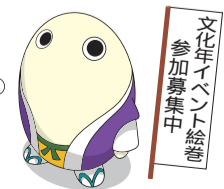
国民文化祭・京都2011 PR隊長 まゆまる