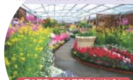
-花の回廊-早春の草花展 2/19(金)- 2万株にも及ぶ花の競演。甘い香りに包まれた花小路を歩いてみませんか。

総合窓口 府民総合案内・相談センター ☎075-411-5000 075-411-5001 411-5000@pref.kyoto.lg.jp