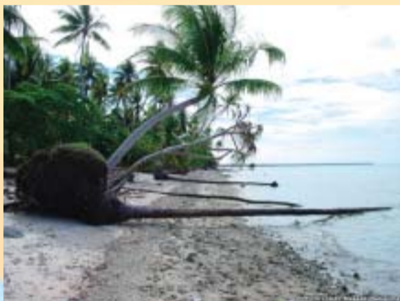
海岸侵食(マーシャル諸島)