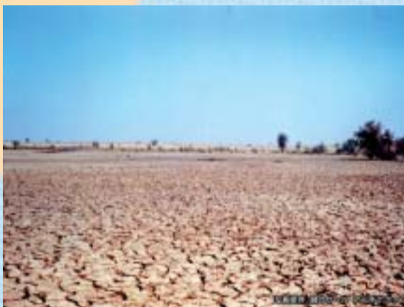
地球温暖化による異常気象(例:干ばつ)

集中豪雨や干ばつ、海面の上昇による洪水など、地球温暖化の影響と考えられる異常気象が地球規模で発生しています。世界各国が地球温暖化防止に取り組んでいるとはいえ、依然として温室効果ガスの排出量が増え続けている現在、私たちはまさに地球の危機に直面していると言えます。美しい地球を未来に引き継ぐために、今こそ一人ひとりの行動が求められています。